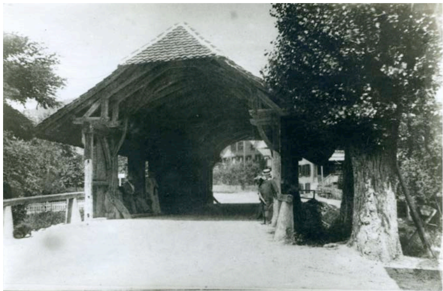
Dorfbrücke (mit Brückenzoll) über die Zulg in Steffisburg, 1765-1886; die Holzbrücke hat allen Hochwassern standgehalten.