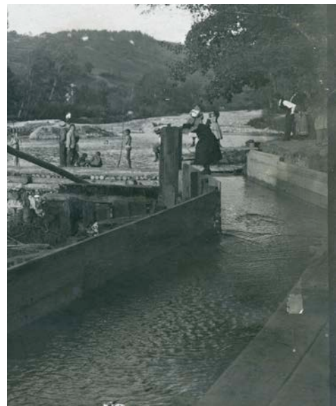
Einlauf vom Mühlbach neben provis. Stauwehr der Müllerschwelle, 1907

Der Mühlbach, auch Mühlwuhur genannt, wird 1354 erwähnt, er bestand aber schon früher. Er wurde aus der Zulg abgeleitet, bevor eine Querschwelle gebaut war. Sein Einlauf musste nach jedem Hochwasser wiederhergestellt werden. Bis 1907 bestand die sog. Müllerschwelle aus einer Holzschwelle, die mit fünf Meter langen, dicken Brettern abgedacht und oben durch Firstbalken geschützt war. An der linken Zulgseite, beim Einlauf des Mühlbachs nahm ein breiter, massiver und tiefer Holzkasten das Bachwasser auf. Von da führte ein mit einer Britsche (Holzschieber) verschlossener Schutzkänel zurück in die Zulg. Bei Hochwasser konnte durch diesen Känel der grösste Teil des Geschiebes mit dem Wasserüberschwall in den Bach abgeleitet werden.